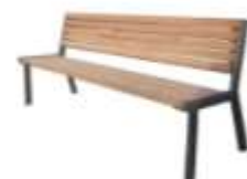
SENIORSKÁ LAVIČKA BOLZANS