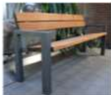
SENIORSKÁ LAVIČKA CARMENS