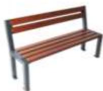
SENIORSKÁ LAVIČKA TRENDS