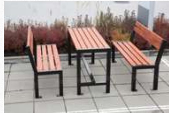
Piknikové venkovní posezení