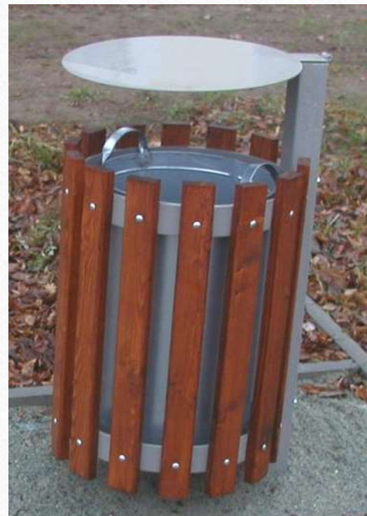
Odpadkové koše venkovní kryté