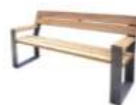
SENIORSKÁ LAVIČKA WOODS