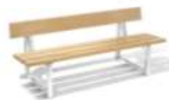
SENIORSKÁ LAVIČKA COOLS