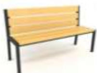
SENIORSKÁ LAVIČKA TERAXS