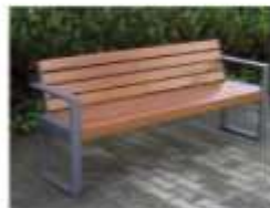
SENIORSKÁ LAVIČKA LEONS