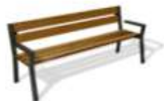
SENIORSKÁ LAVIČKA KARIMS